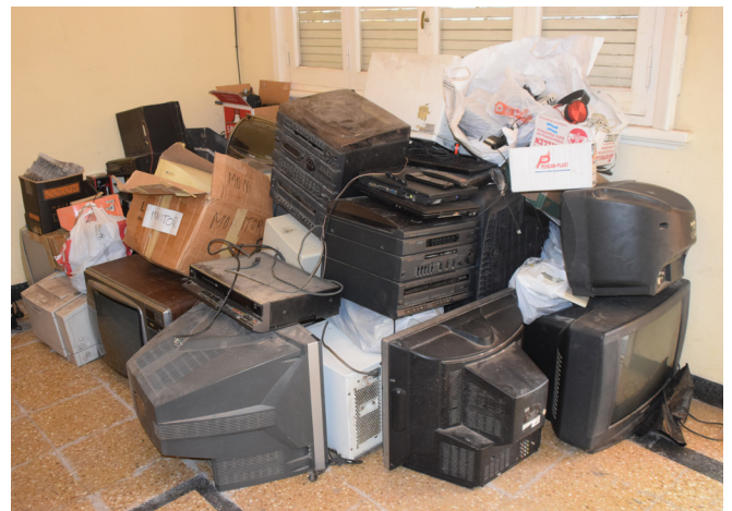
Todos los residuos eléctricos/electrónicos y artefactos tecnológicos sin uso recolectados durante la jornada del día 14 de Diciembre de 2019 en los diferentes puntos de encuentro, aproximadamente 500 Kilogramos.