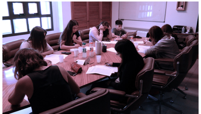
Alumnos realizando el examen para las Becas.