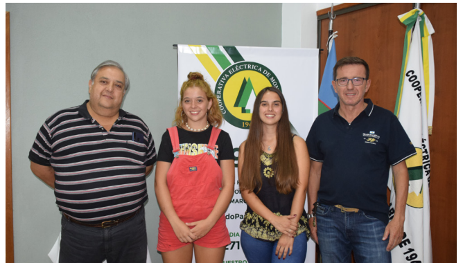
Integrantes del Consejo de Administración felicitando a las ganadoras de las Becas.